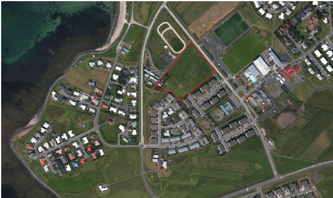
Mynd 1: Skipulagssvæðið fyrir Sveinskotland er merkt inn með rauðu.

Skipulagssvæðið er afmarkað á mynd 1 og er um 2,3 ha að stærð.